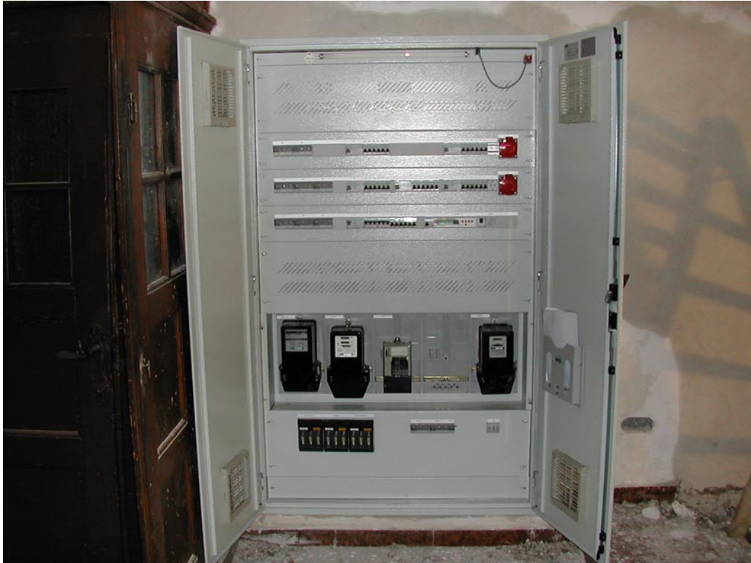
3. Verteiler und Heizungssteuerung in der Sakristei