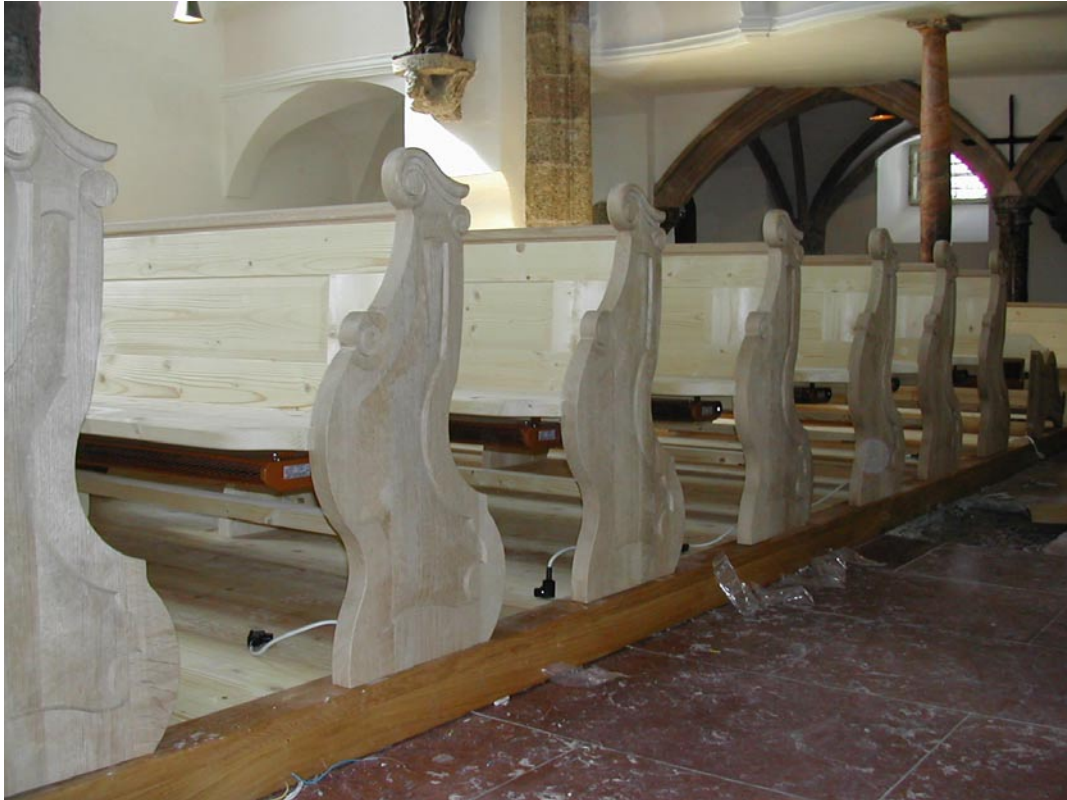
7. Montage: Anschlussstecker montieren