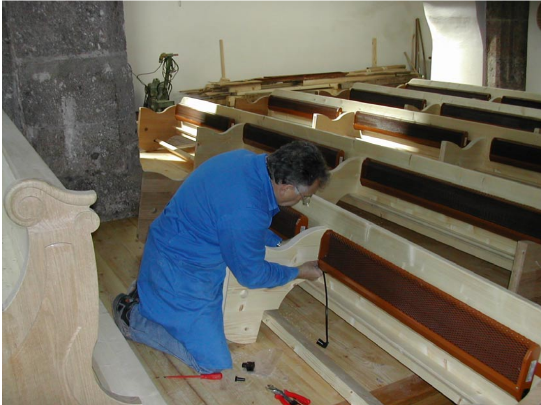
5. Montage: Kirchenbankstrahler montieren und Durchführung der Verbindungsleitung