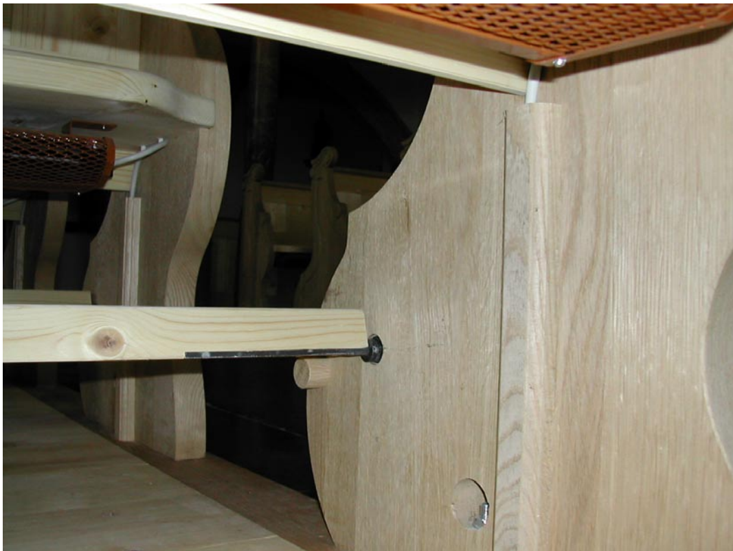
8. Montage: Kabelführung der Zuleitung