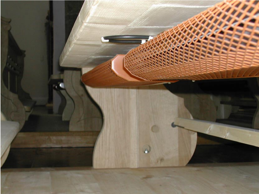
9. Blick unter die fertige Bank