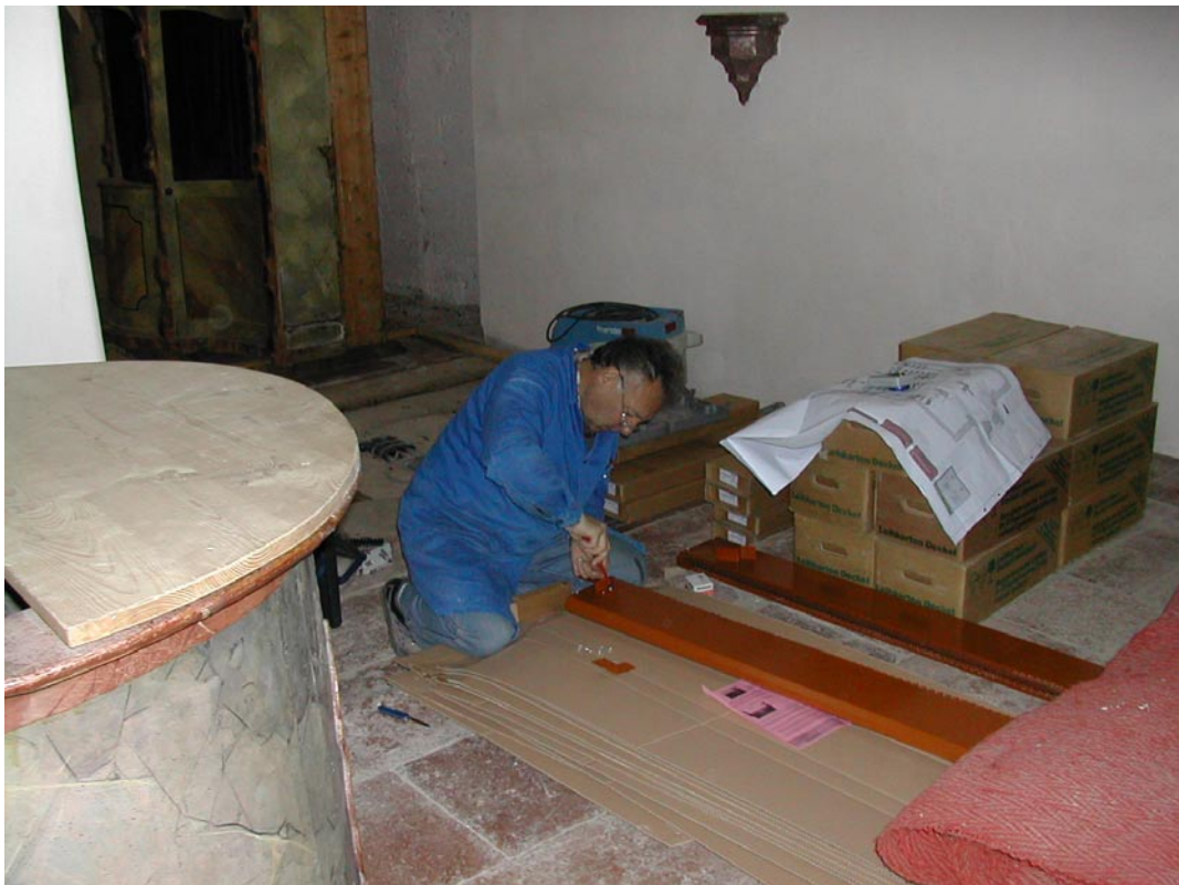
4. Vorbereitung Kirchenbankstrahler: auspacken und Montagefüße anschrauben