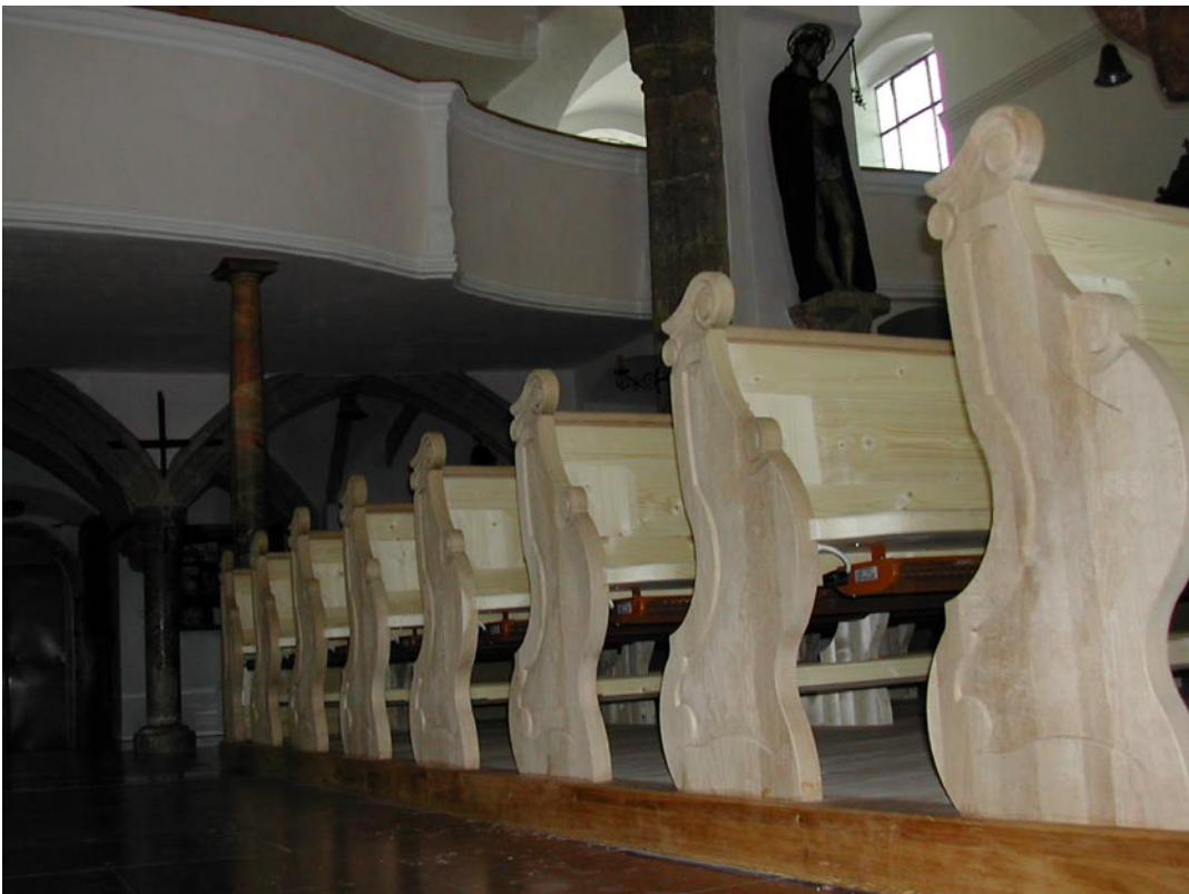
10. Totalansicht der fertigen Kirchenbankheizung